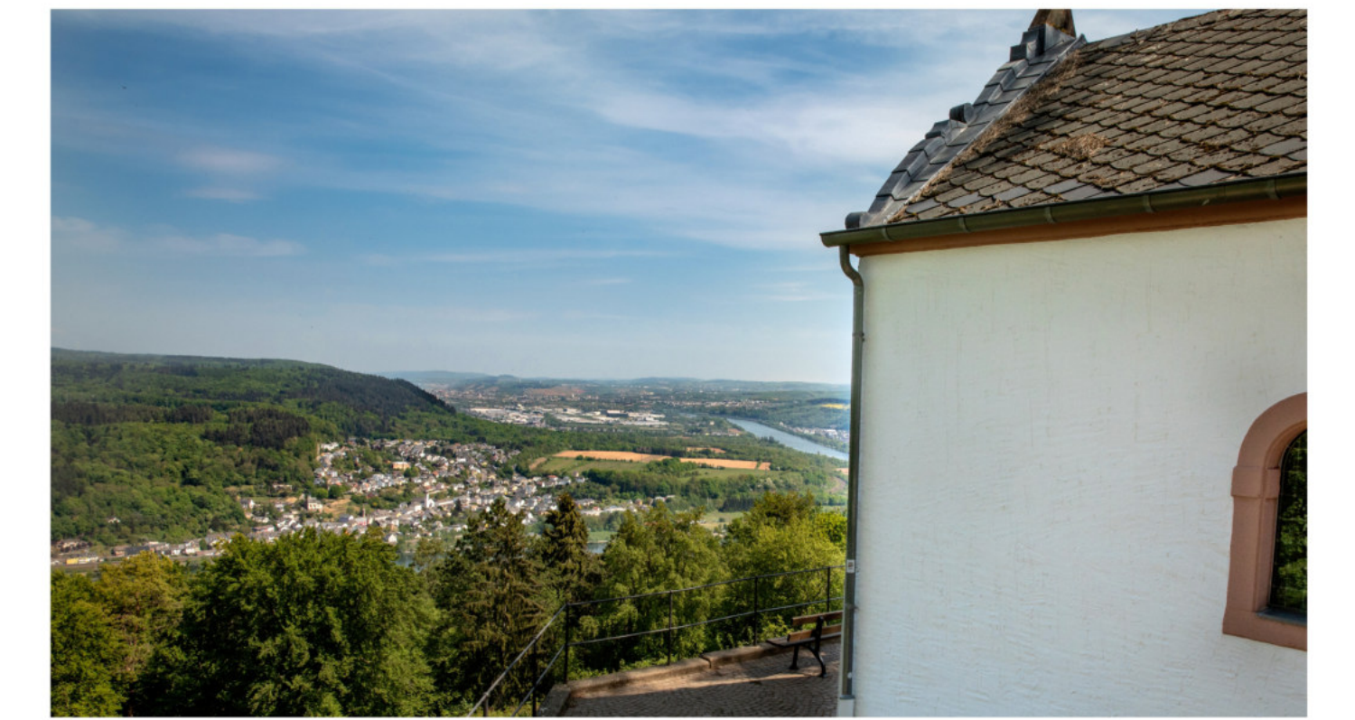
Löschemer Kapelle mit Tablick nach Trier