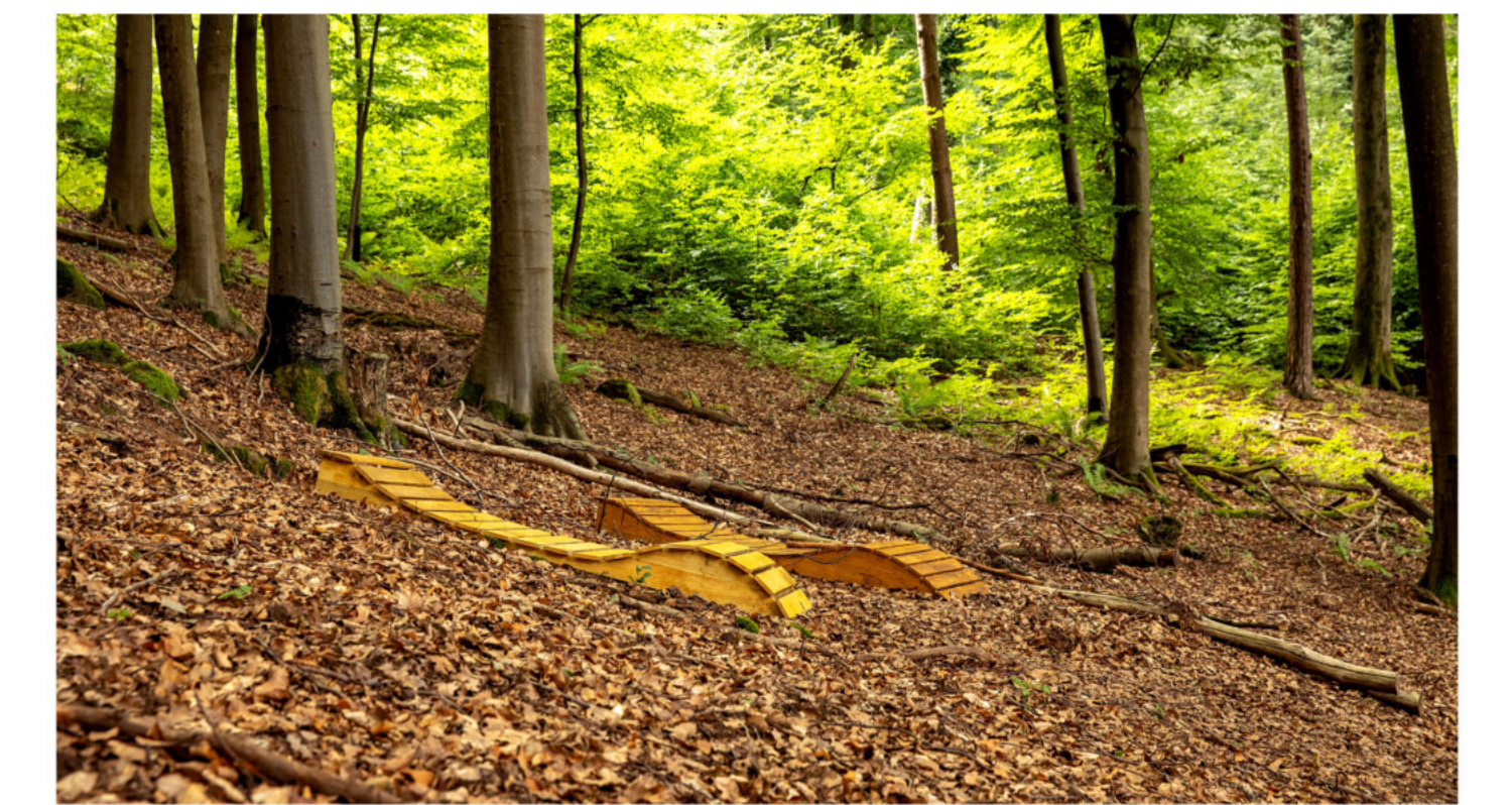
Naturtherapie Shinrin-Yoku / Waldbadeplatz