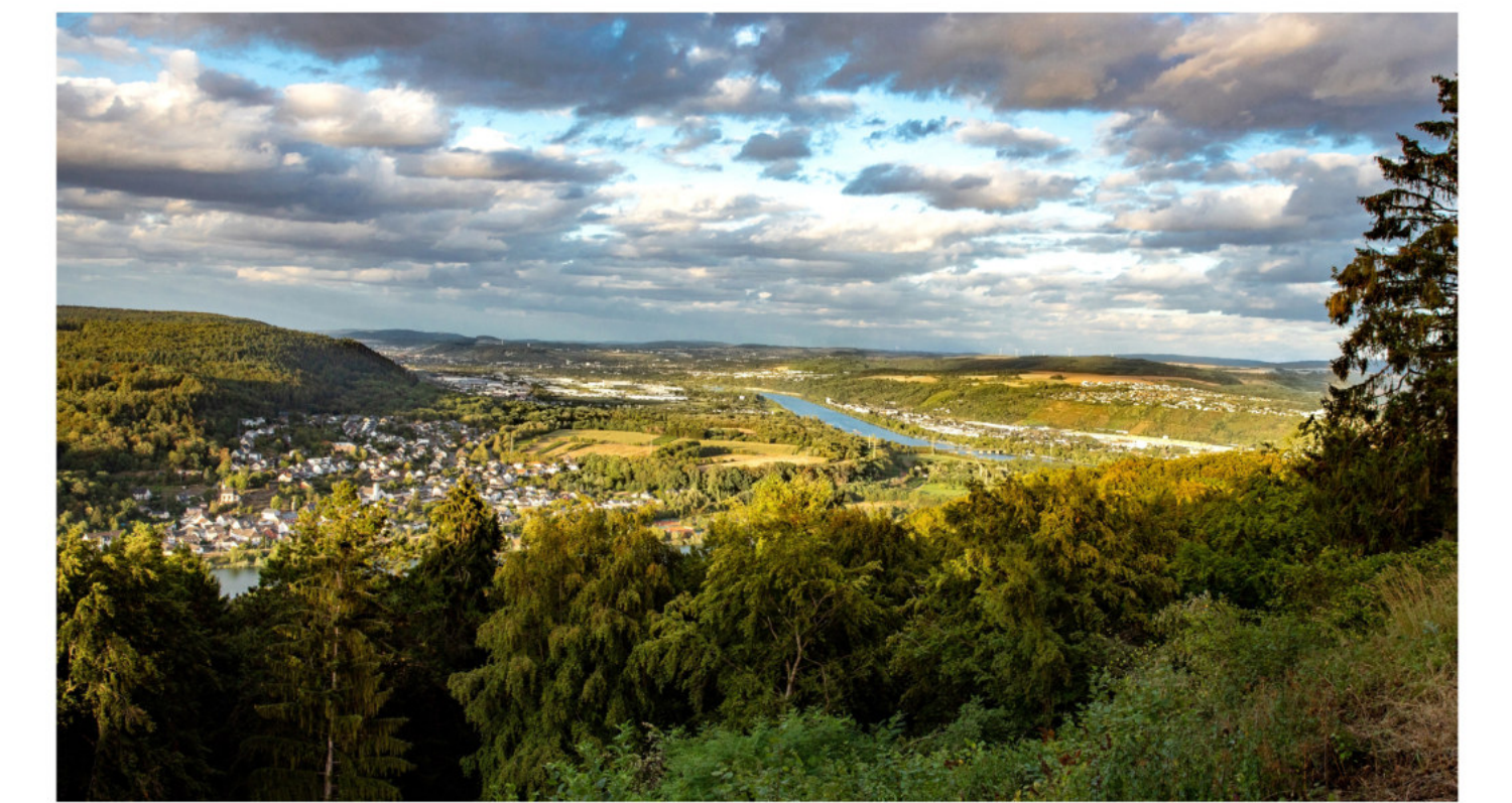
Blick von Löschemer Kapelle bis nach Trier