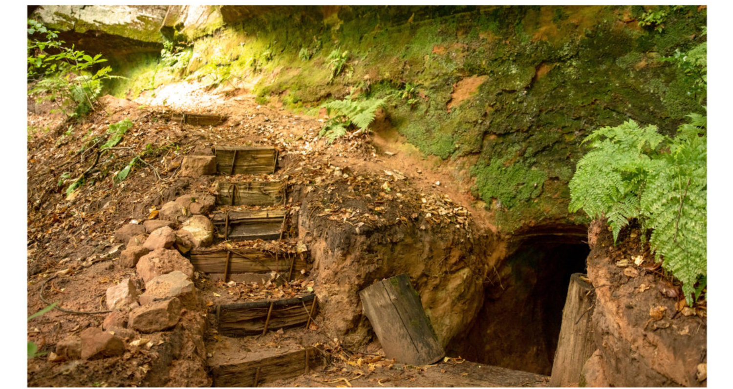
Felsenpfad / Höhle mit Gesteinsschichten