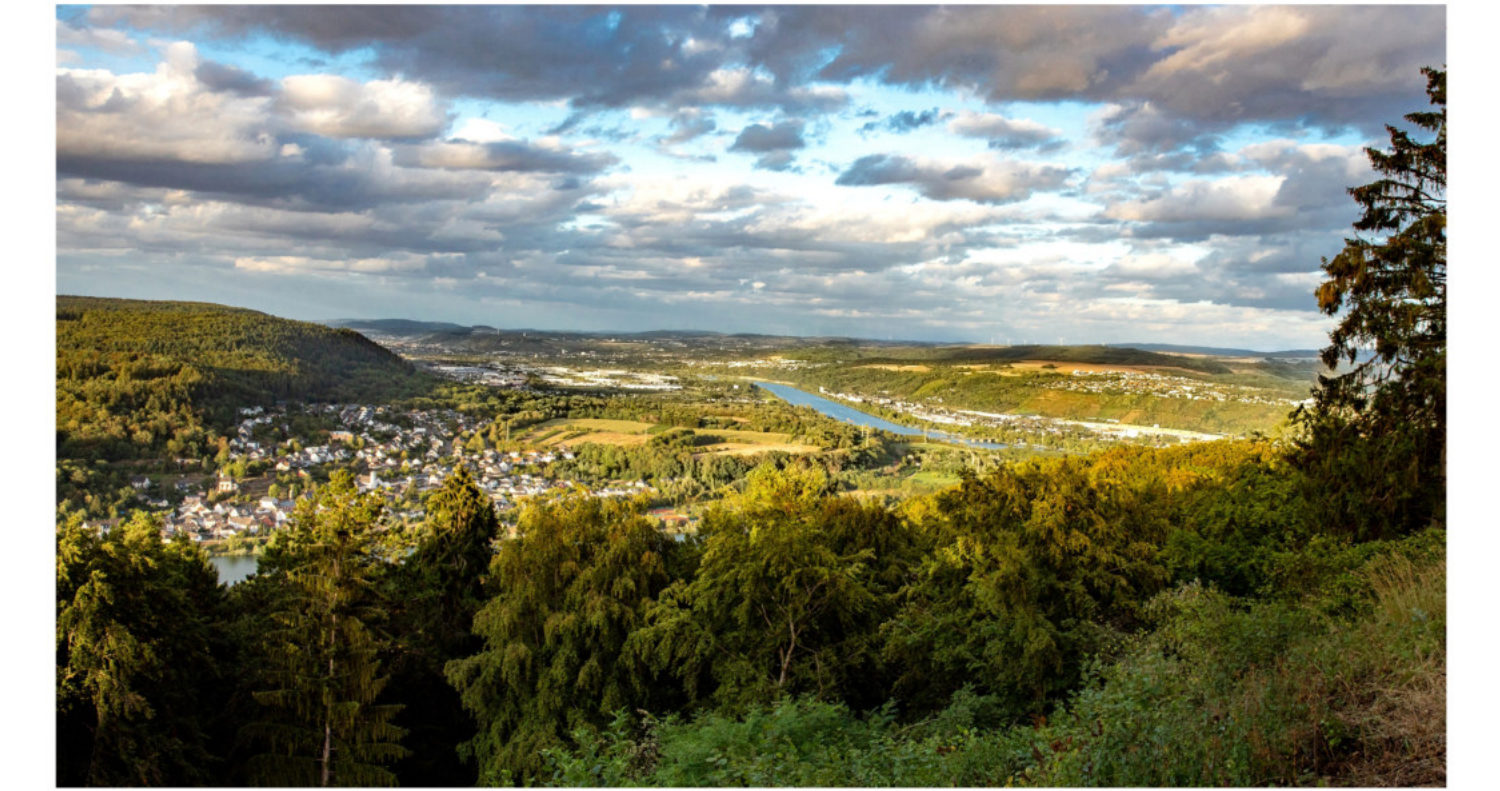
Löschemer Kapelle mit Tablick nach Trier