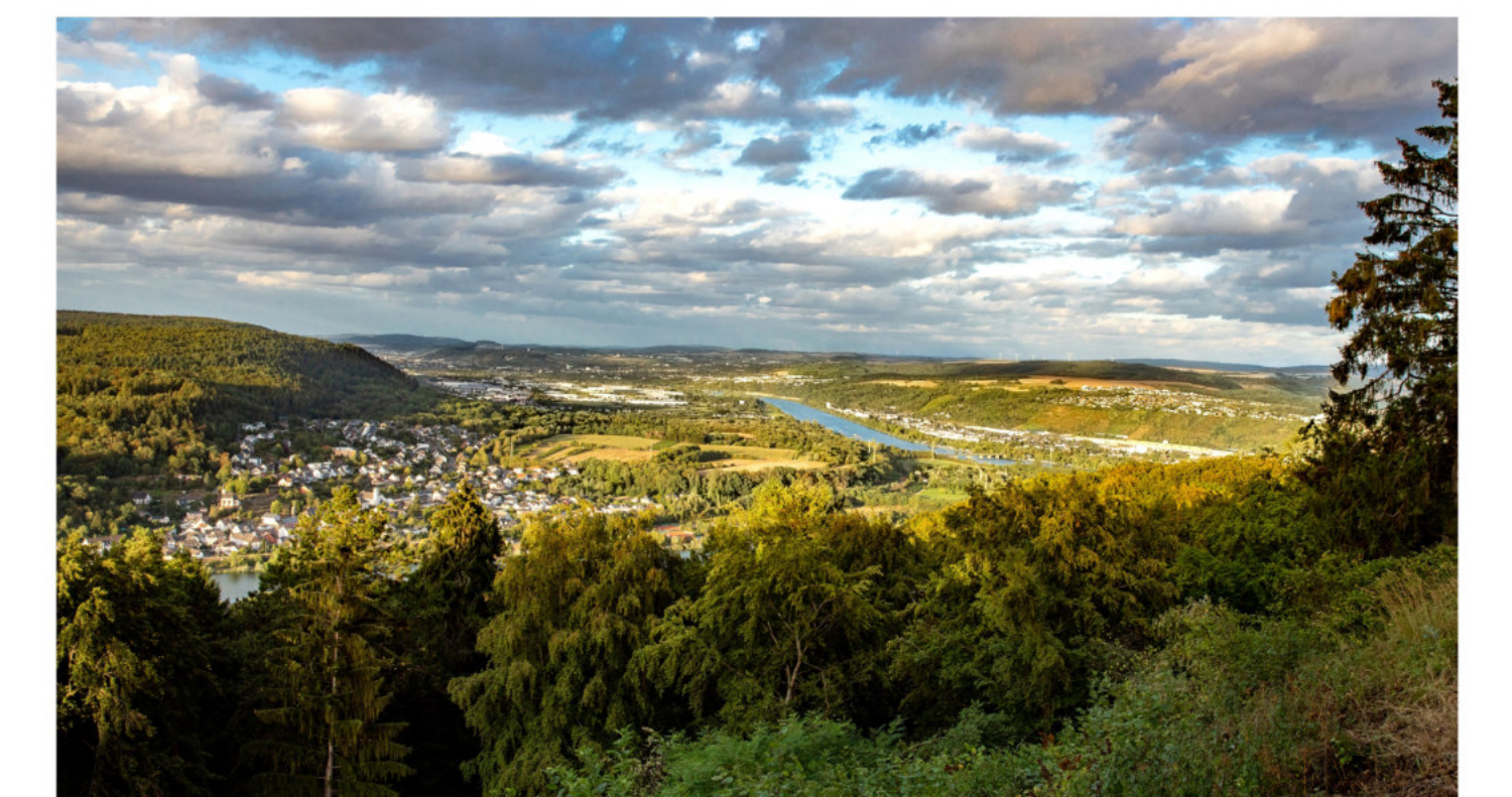
Talblick von der Löschemer Kapelle nach Trier