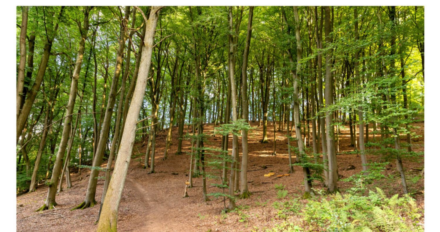
Hallenwald mit Shinrin-Yoku-Platz (Waldbaden)