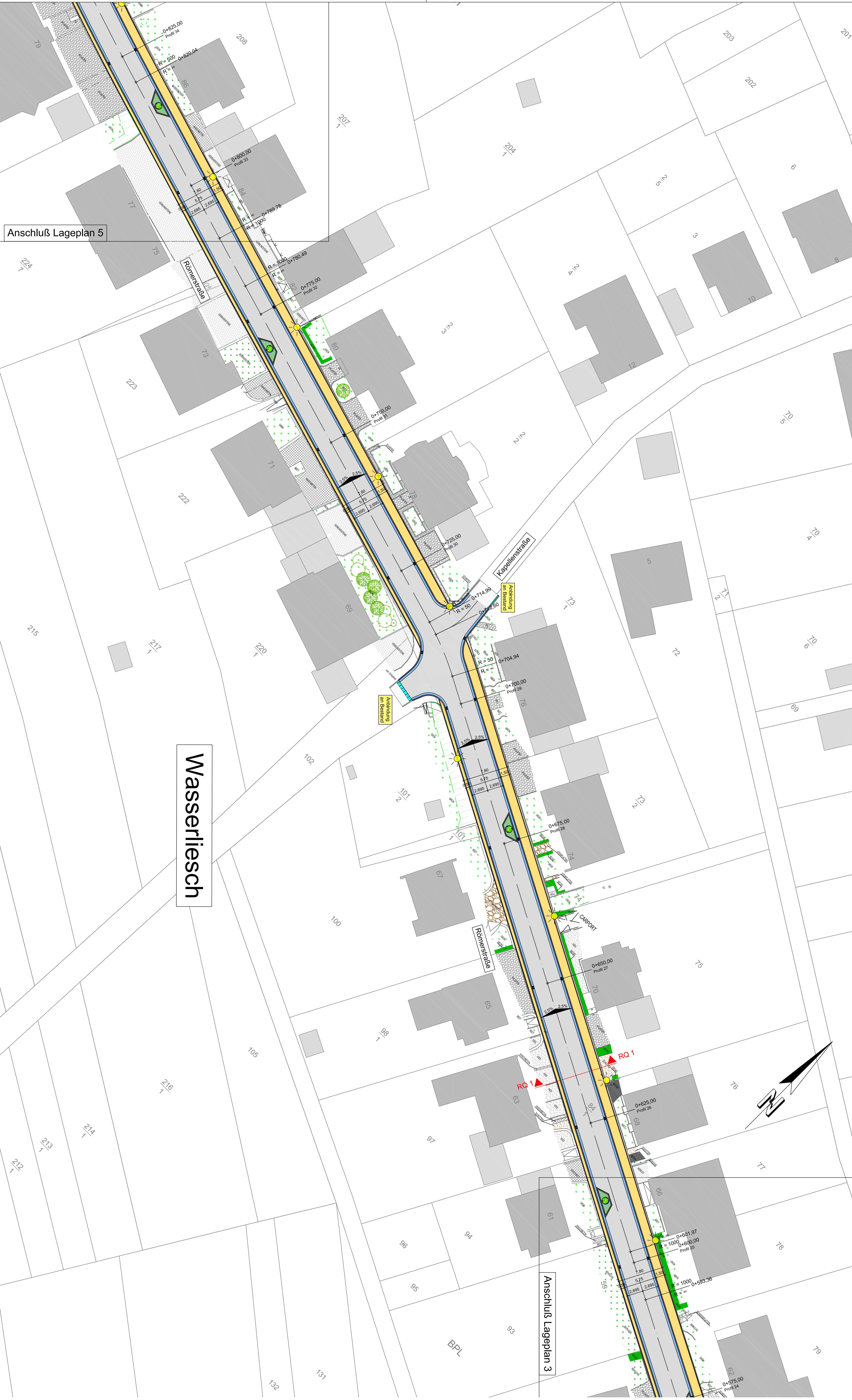
Anschluß Lageplan 5