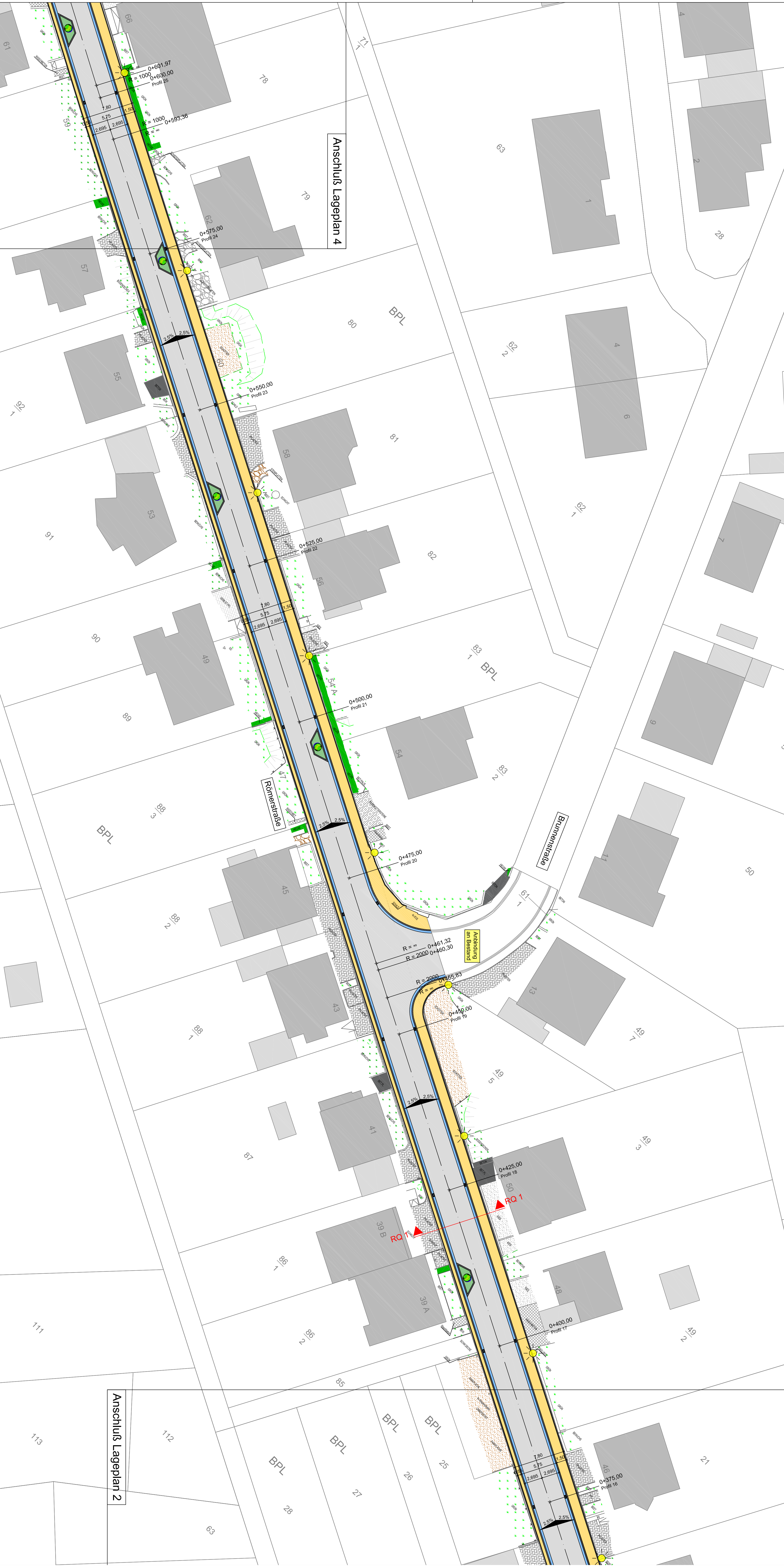
Anschluss Lageplan 4